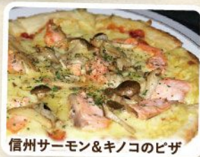
信州サーモン&キノコのピザ