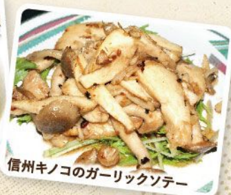
信州キノコのガーリックソテー