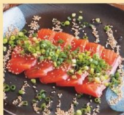
信州サーモン カルパッチョ 930円