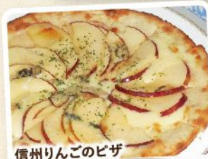
信州りんごのピザ