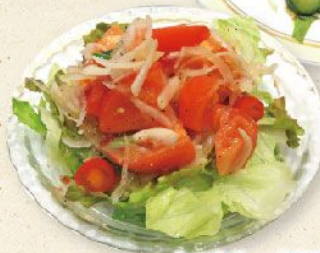
トマトたっぷりサラダ