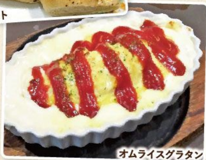
オムライスグラタン