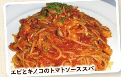
エビとキノコのトマトソーススパ