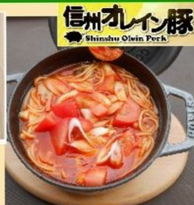
信州オレイン豚 & トマトオーブラーメン 各種950円