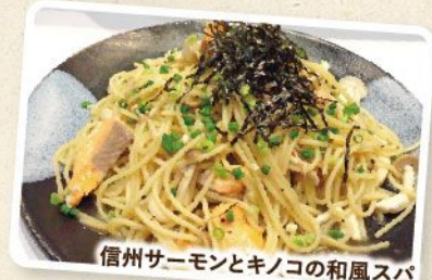
信州サーモンとキノコの和風スパ