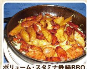
ボリューム・スタミナ鉄鍋BBQ