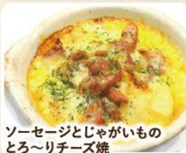
ソーセージとじゃがいもの とろ〜りチーズ焼