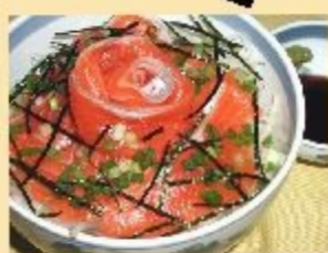
信州サーモン丼 950円