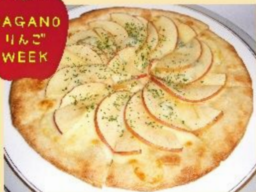
信州りんごのピザ 1050円