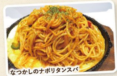
なつかしのナポリタンスパ