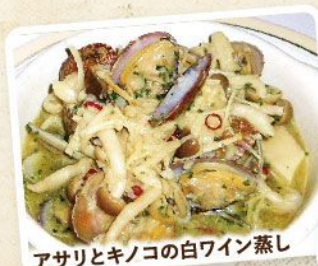
アサリとキノコの白ワイン蒸し