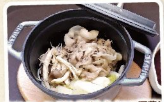
信州オレイン豚と長葱とキノコの酒蒸し