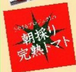
長野市産完熟トマト380円