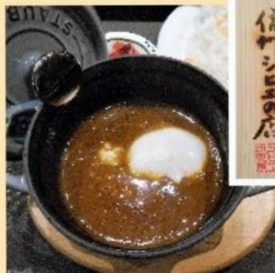
ジビエ料理 しなの鹿カレー1050円