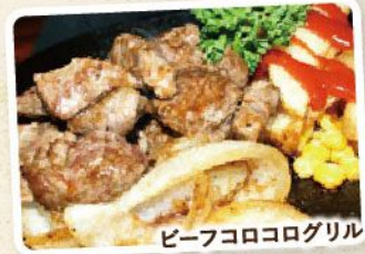
ビーフコロコログリル