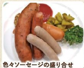
色々ソーセージの盛り合せ