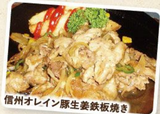
信州オレイン豚生姜鉄板焼き