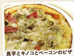
長芋とキノコとベーコンのピザ