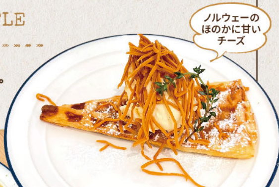
クロッフル&バニラアイス ブラウンチーズがけ