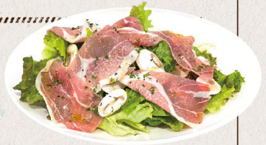
▶ 掬月さんの生ハムサラダ 1,380yen