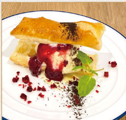
▶ 焼きたてパイ バニラアイスサンド 550yen