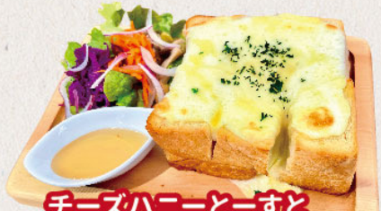
チーズハニーとーすと サラダ付き 750yen