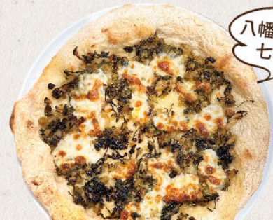
野沢菜とモッツアレラチーズ 1,100yen